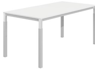
Ρυθμιζόμενο ύψος / Adjustable height