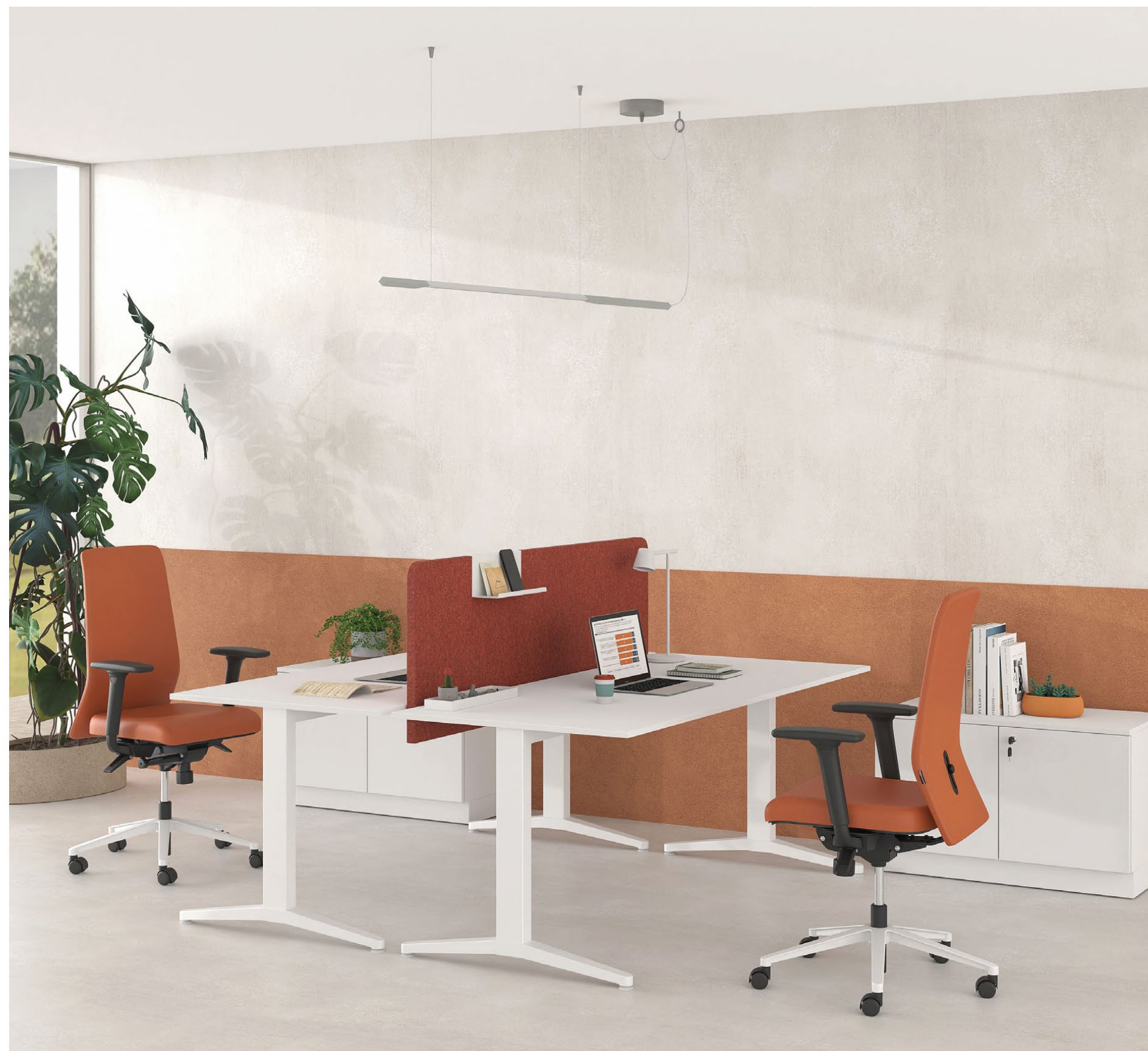
Alma S - Γραφείο σταθερού ύψους / Fixed height desk