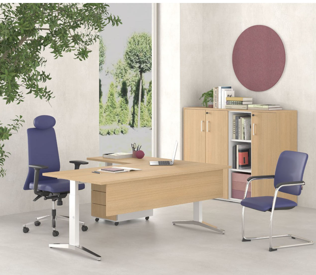
Alma K - Γραφείο ρυθμιζόμενου ύψους με γυαλισμένο πέλμα / Height adjustable desk with polished foot